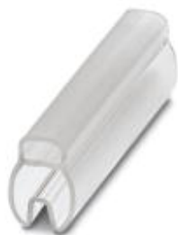
导线标记条支架，透明，未标记，安装方式: 滑块，电缆直径范围: 4 - 7 mm，标识区域大小: 30 x 4 mm

Please be informed that the data shown in this PDF Document is generated from our Online Catalog. Please find the complete data in the user's documentation. Our General Terms of Use for Downloads are valid ( http://download.phoenixcontact.com )